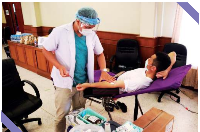
เมื่อวันที่ 7 มีนาคม 2565 เวลา 10.00-15.00. น.หัวหน้าส่วนราชการ ข้าราชการ พนักงานเทศบาลตำบลเชิงทะเล ร่วมกิจกรรมการบริจาคโลหิตเพื่อใช้เป็นโลหิตสำรอง ณ ห้องประชุมเทศบาลตำบลเชิงทะเล (ชั้น 3)